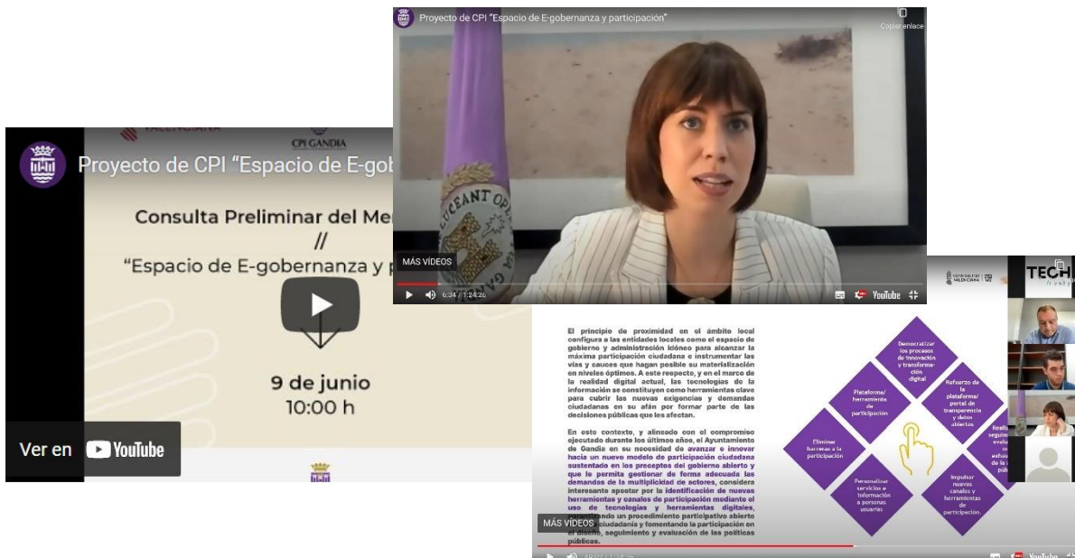
Imágenes de la presentación del proyecto durante la Jornada