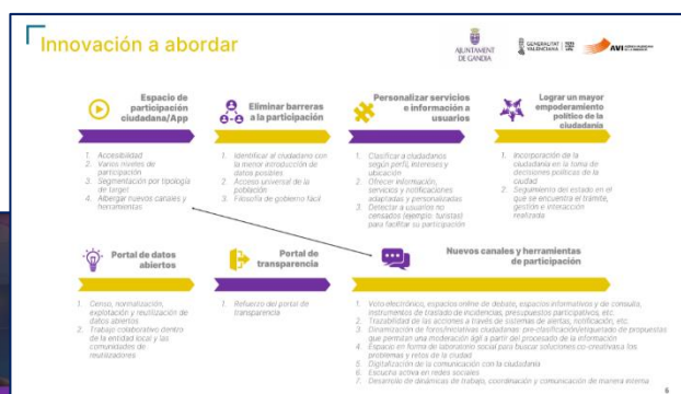
Imágenes del documento utilizado durante el evento